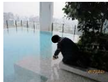
สระว่ายน้ำส่วนตื้น